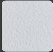
Ferrari-Weiß / Ferrari-White 10120