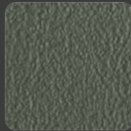
Oliv Grün / Olive Green 20253