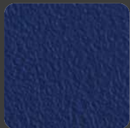
Dunkelblau / Dark Blue 10295