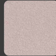
Alt-Rosa / Alto-Pink 20293