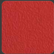
Ferrari-Rot / Ferrari-Red 07478