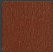
Rotbraun / Reddish Brown 20278