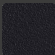
Matt-Schwarz / Matt-Black 00002