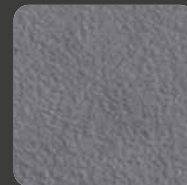
Dunkelgrau / Dark Grey 07432