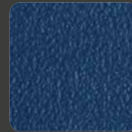
Königsblau / Royal Blue 20284