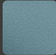
Pastell Blau / Pastel Blue 20290