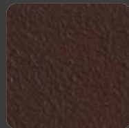
Braun / Brown 20129